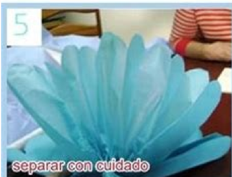
separar con cuidado