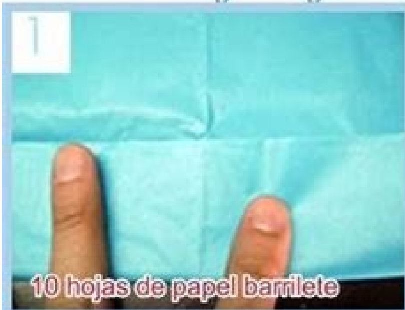
10 hojas de papel barrilete