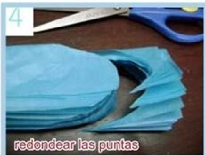
redondear las puntas