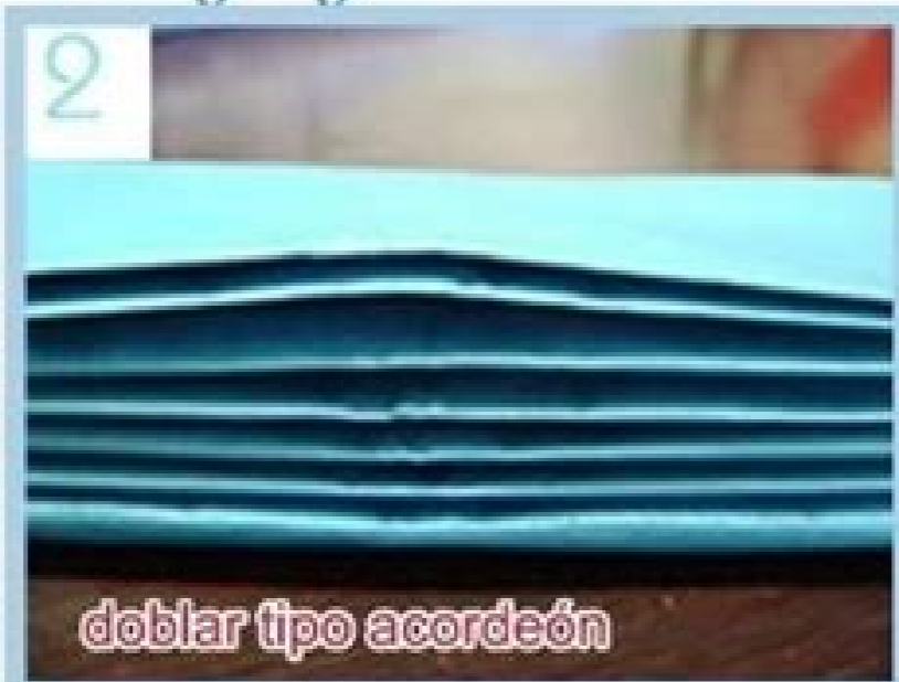
doblar tipo acordeón