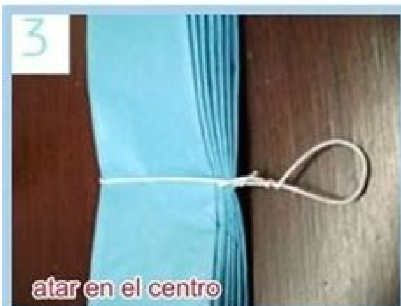
atar en el centro